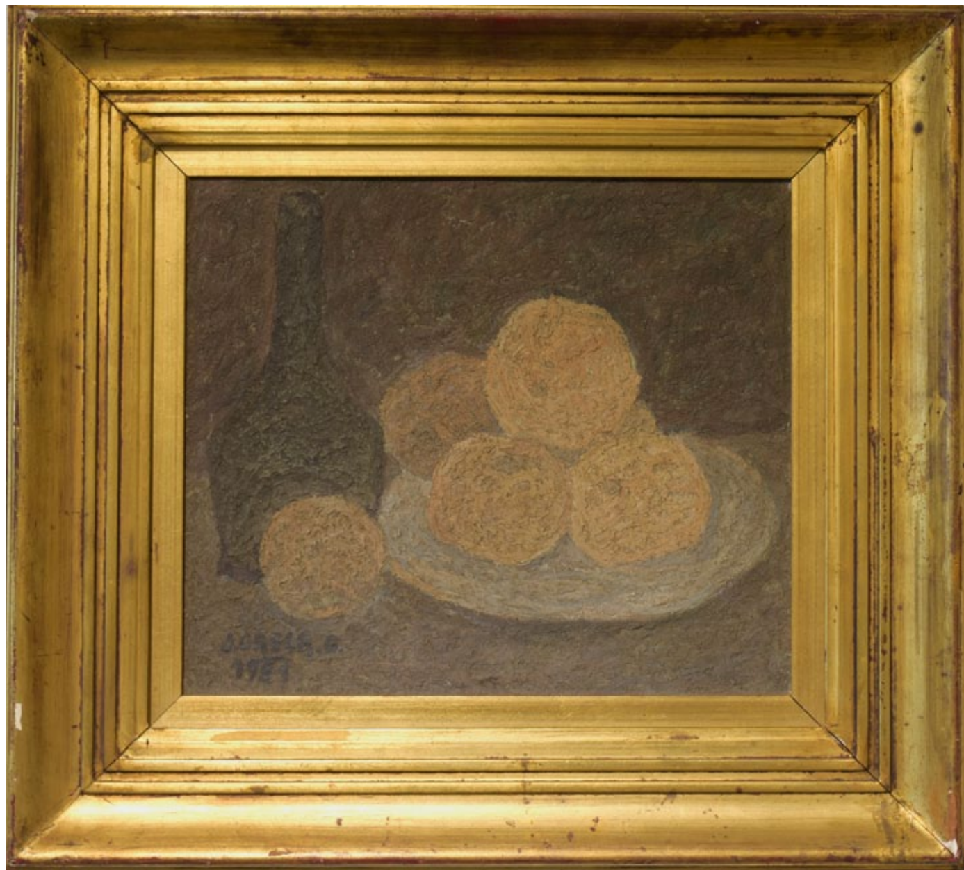
Juan Grela Naturaleza Muerta Óleo Año 1937