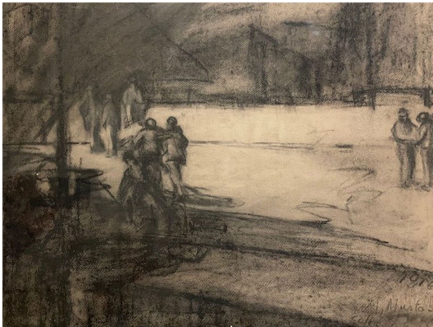
Manuel Musto Paisaje Urbano de 1916 Carbonilla