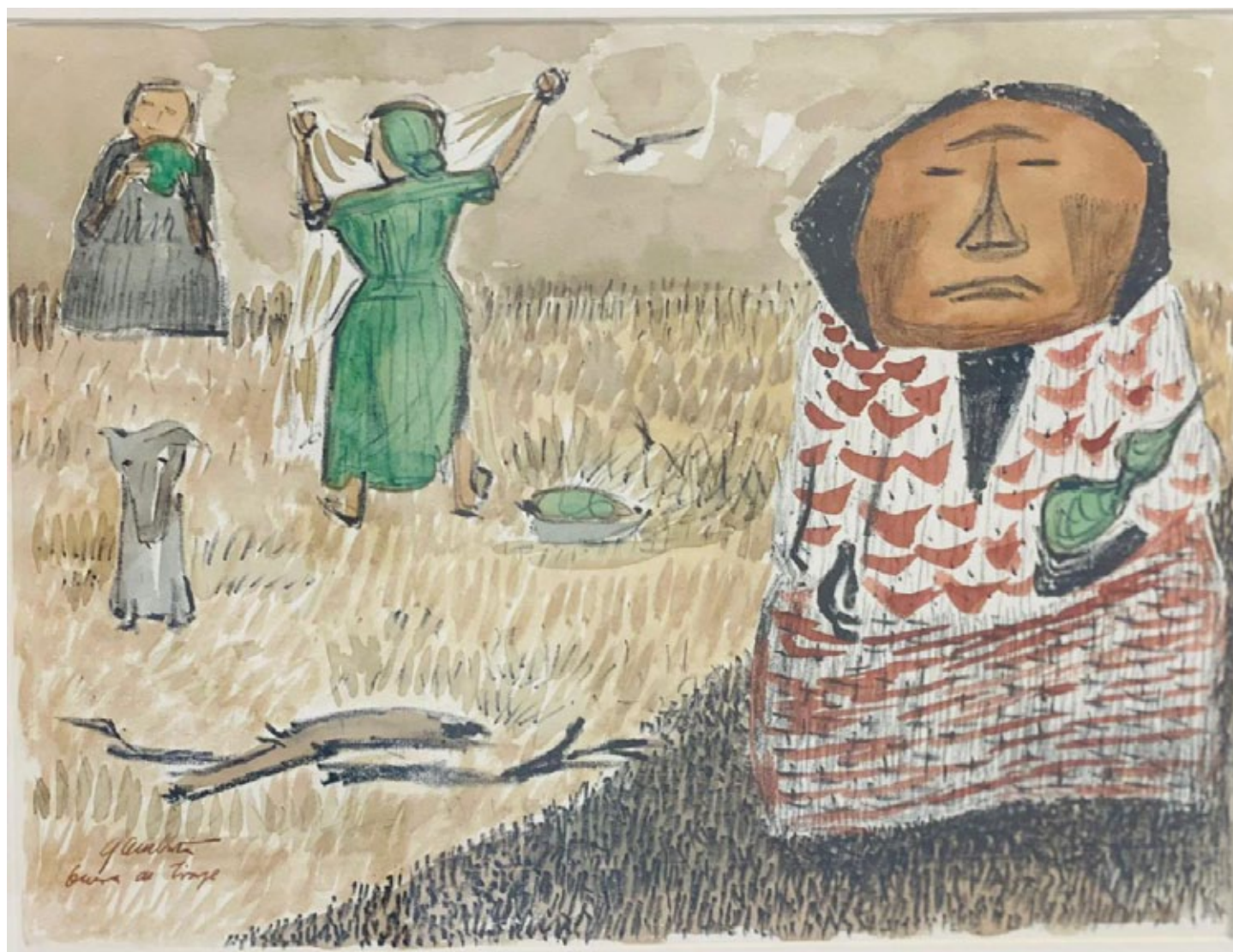
Leónidas Gambartes Figuras Litografía Fuera de Tiraje Coloreada