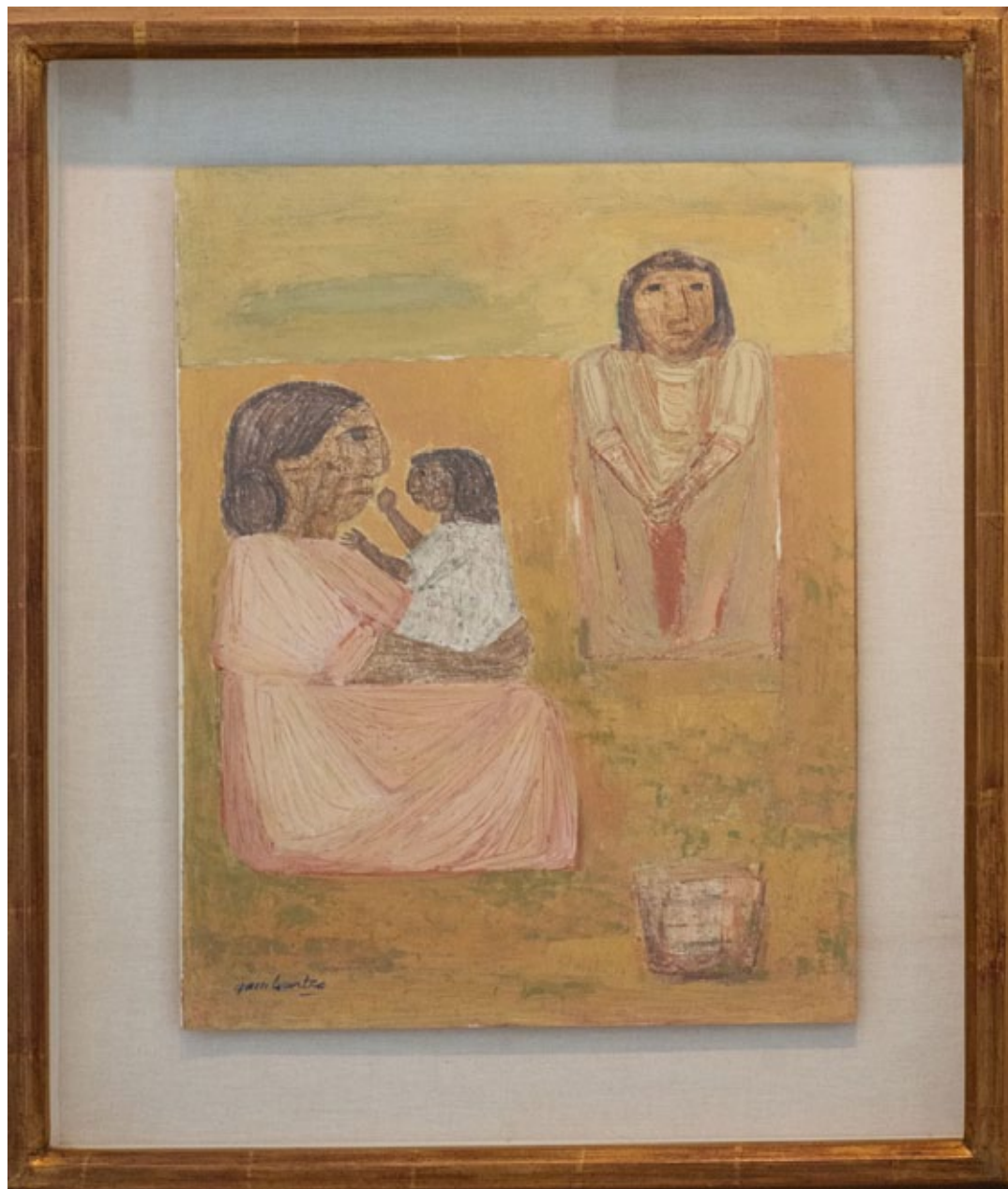
Leónidas Gambartes Tres Generaciones Cromo Al Yeso