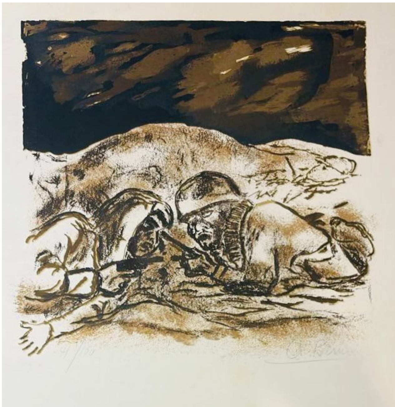
Antonio Berni Los Soldados Serigrafía Con tiraje y firmada