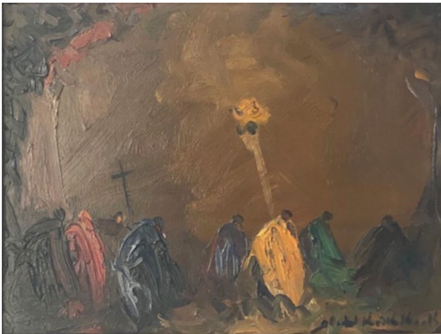
Stephen Koeh-Koeh La Procepción Óleo . 25 cm x 30 cm