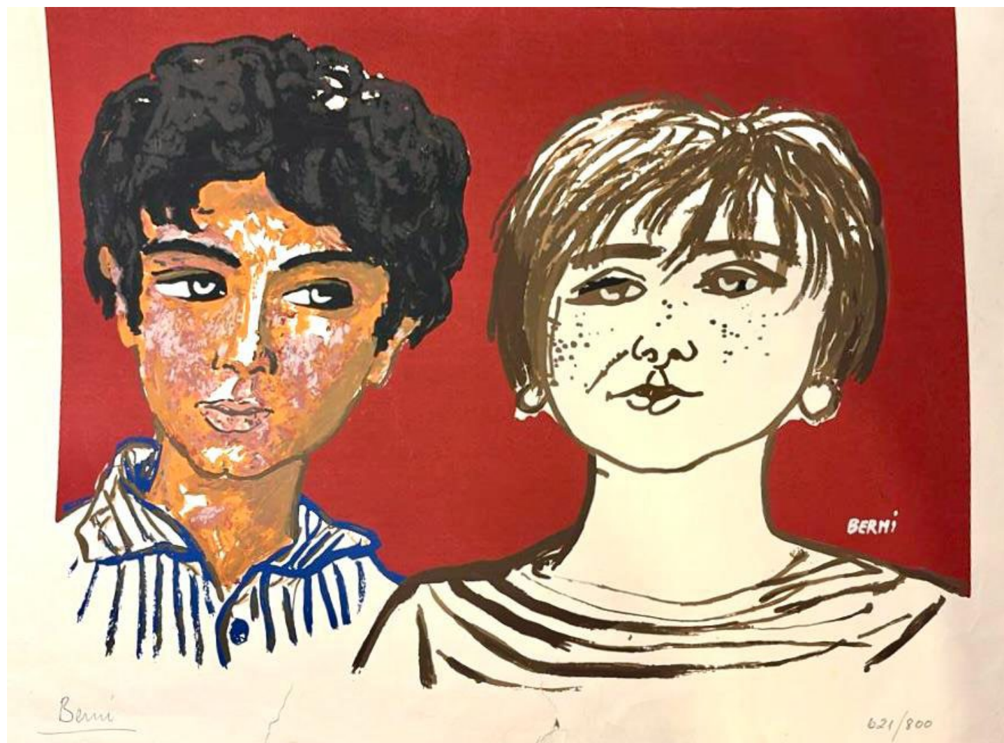
Antonio Berni Los Niños Serigrafía Con Tiraje Y Firmada