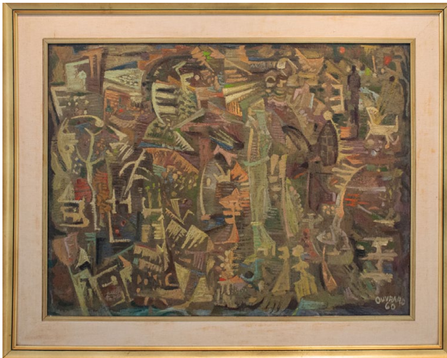
Luis Ouvrard Sin Título . Año 1960 Óleo 60cm x 80cm