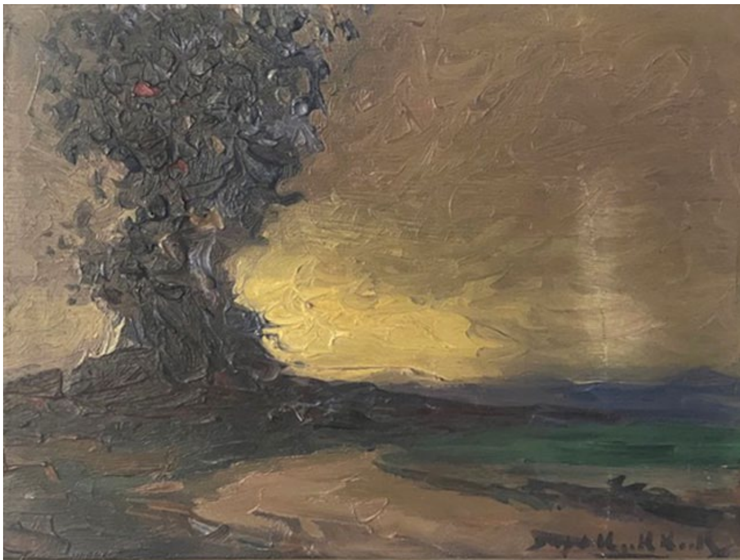
Stephen Koeh-Koeh Árbol Al Amanecer Óleo . 25Cm X 30Cm