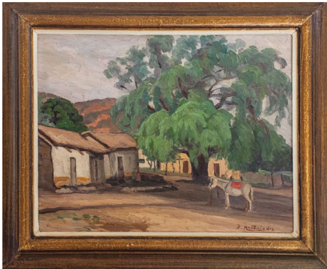
Demetrio Antoniadis Paisaje Serrano Óleo